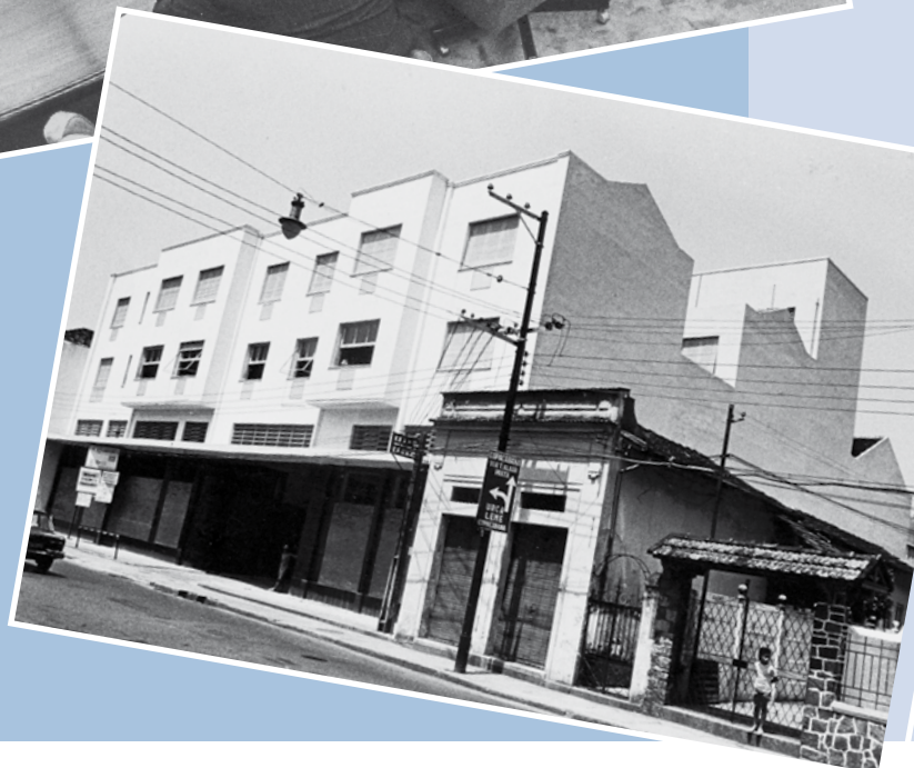
Na época da fundação, uma reunião da diretoria, e a primeira sede, na Rua São João Batista, em Botafogo